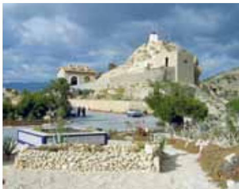
Cueva de San Pascual. ▲