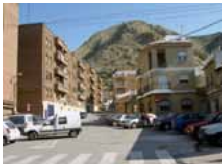
▲ Lugar del convento capuchino.

nador, que solíamos utilizar en grandes y contadas ocasiones para tener merienda-cena. Lo usábamos especialmente en los días solemnes de la Pascua. En el mes de abril, sí. Cuando ha brotado ya bien la primavera y los días son más largos.