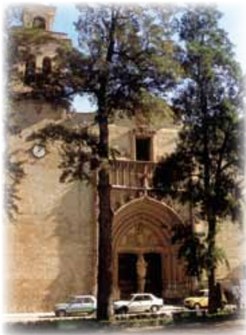
Iglesia de Santiago. ►

—De celebrar misa en la ermita de San Antonio. Es la que se ve ahí arriba en el recodo del camino. Cuando nos desprendimos del convento nos quedamos únicamente con este trocito de tierra al pie del monte. El camino llega hasta una gruta dedicada a la Virgen. En tiempos pasados quisimos también tener allí el cementerio conventual. Pero no lo permitieron las autoridades sanitarias de la ciudad. En un recodo amplio del camino, precisamente donde veis hoy la ermita, habíamos adecentado entonces una especie de ce-