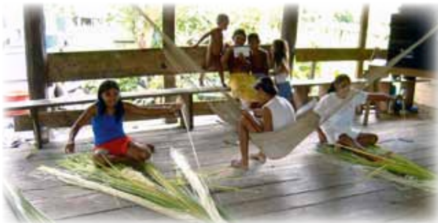
▼ Guayo. Trabajando la palma del moriche.