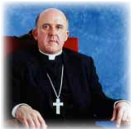
▲ Mons. Carlos Osoro Sierra.

El nuevo señor arzobispo desarrollará su ministerio pastoral en una diócesis de 13.060 km 2 y al servicio de 3.165.000 habitantes. Y tendrá, como colaboradores en su ministerio pastoral, a 1.600 sacerdotes –la mitad del clero diocesano, la otra mitad del clero regular– y a casi 4.000 religiosas y miembros de movimientos que trabajan en Valencia pertenecientes a 150 congregaciones, instituciones y movimientos que cuentan con representación en la diócesis.