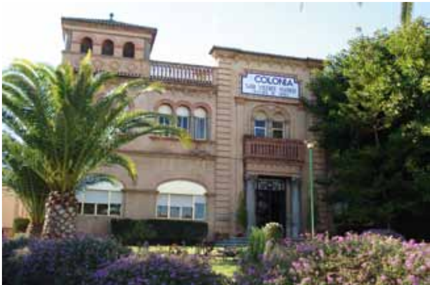
Colonia San Vicente Ferrer, Burjasot (Valencia). ▲