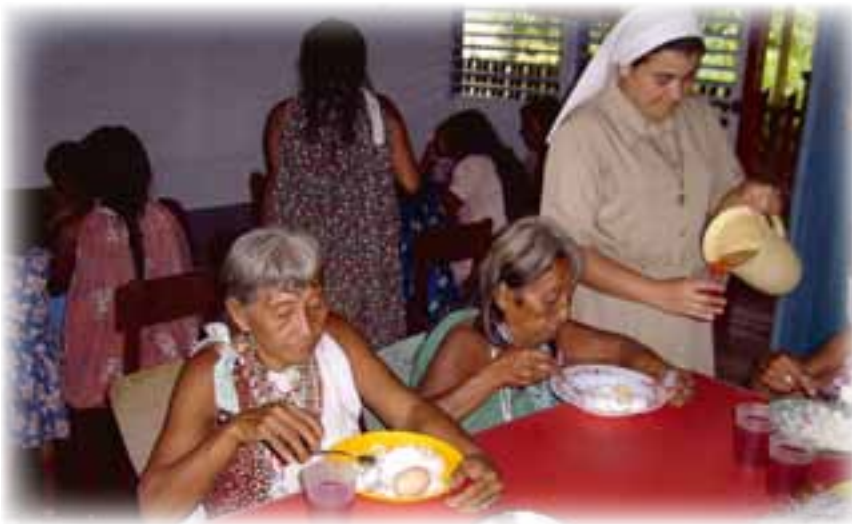
Guayo. Obra social de las Hnas. Terciarias Capuchinas. ▲

ardor misionero de sus hijas Terciarias Capuchinas que, antes y ahora, surcan los caños del Orinoco en servicio a los indígenas con una entrega generosa y una admirable confianza en el Señor.