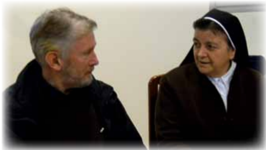
En la casa de las Hermanas, Masamagrell (Valencia). ▲

Luego, recordando la figura de Luis Amigó, pone de relieve cómo, siendo tan joven, sabe dar respuesta a a necesidades reales del lugar y atender a las fundaciones de la Orden Tercera Seglar. Asimismo habla sobre el proceso de beatificación del Venerable Padre Luis Amigó.