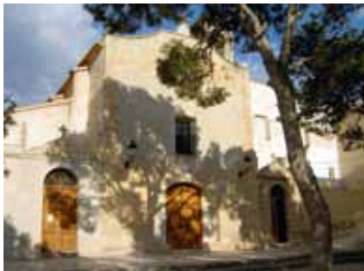
▲ Convento de Orito.

que comprarla, era para servicio de la cocina.