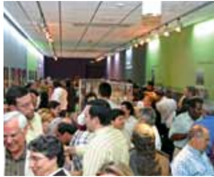
Museo P. Luis Amigó, Godella (Valencia). ▲

La visita del ministro general de los padres capuchinos a los terciarios se enmarca en el LXXV Aniversario del la Muerte del Venerable Padre Luis y como un acto de reconocimiento al apóstol de la juventud extraviada, gran valenciano y hermano suyo en religión.