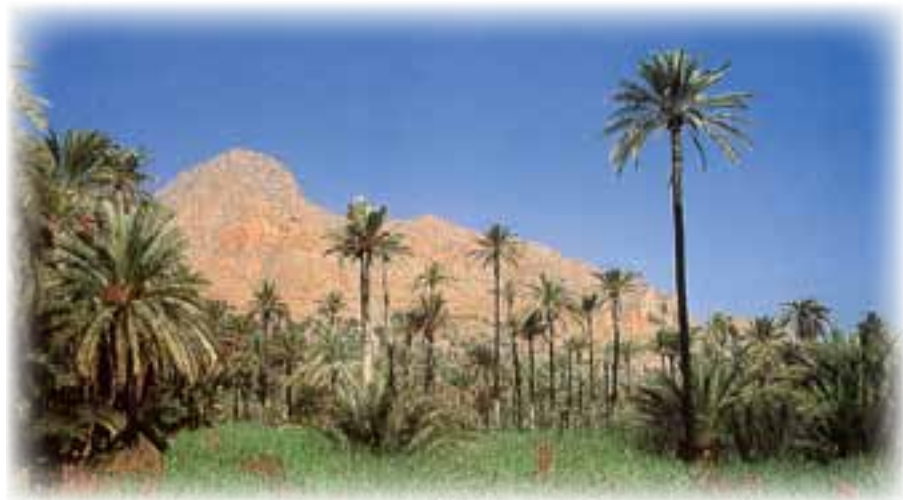
Camino de Orihuela. ▲

-¿Me acompañas mañana a Orihuela, a la huerta del Segura?