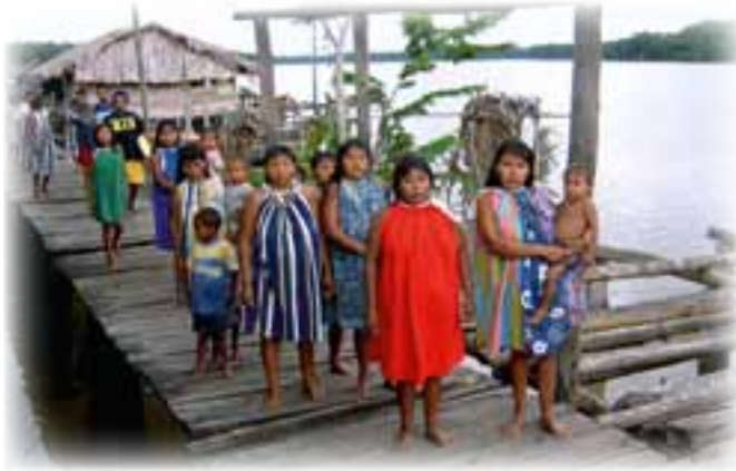
◀ Muraco. Viviendas indígenas.

conjuntamente han escrito también una de las páginas más bellas de la historia de su Orden y de su Congregación.