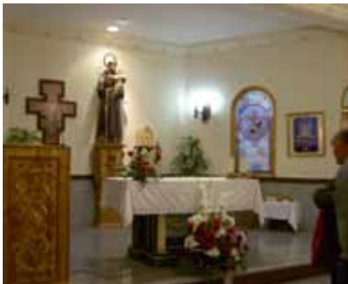
Ermita de San Antonio. ▲

Los padres atendían además a varias ermitas de la huerta del Segura. Por recordar algunas la de Lo Cabello, la de Arneva y la de Santa Cruz. Y, en la práctica, actuaban como vicarios de la iglesia de Santiago, donde atendían las misas y confesiones. Recordad, nos indica