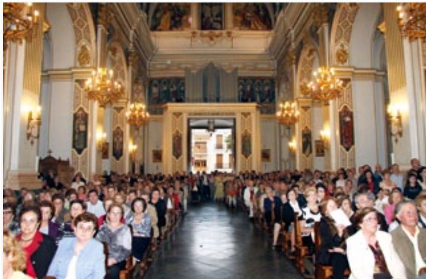
▲ Vista general del templo.