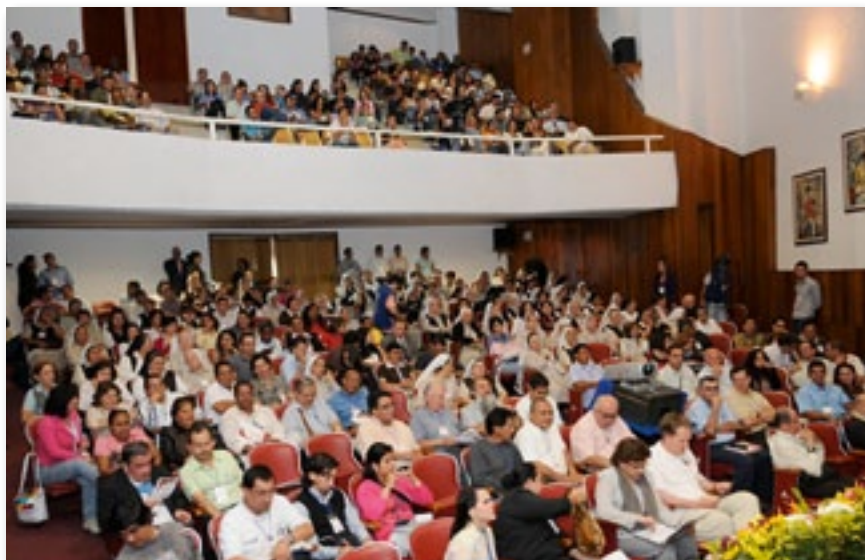
▲ Aula del Congreso.

El congreso se ha desarrollado bajo el lema: Un Universo Carismático, una Misión Social, un Compromiso Académico , y han asistido al mismo más de seiscientos participantes de 17 nacionalidades: Filipinas, Italia, Alemania, Costa de Marfil, República Democrática del Congo y la generalidad de naciones de la América Latina.