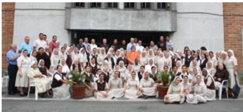
▲ Semana Amigoniana. Medellín, Colombia.