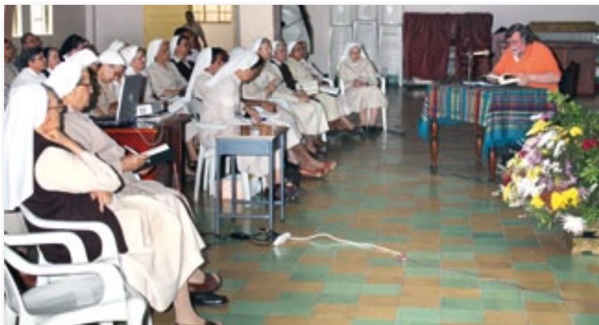
▲ Semana Amigoniana. Bucaramanga, Colombia.

María, del Sagrado Corazón, de Montiel y de San Francisco; hermanas de la Provincia de San José, y laicos amigonianos.