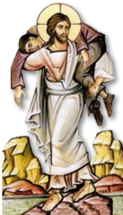
▲ Imagen del Buen Pastor.

De los asistentes a la celebración de la Clausura del Año Jubilar hemos podido distinguir claramente