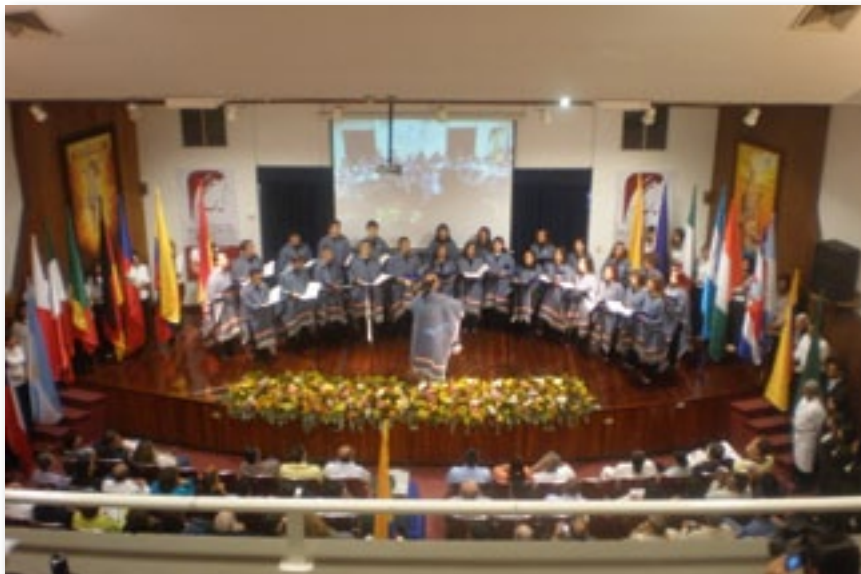
▲ Coro de la Fundación Universitaria Luis Amigó.

las ideas y las costumbres que impone, un mundo sin alma, que nos ayuda a aceptar como único mundo posible y en el que no hay pueblos sino mercados”.