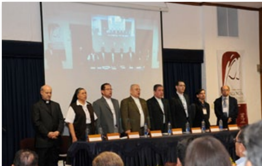
▲ Presidencia del Congreso.