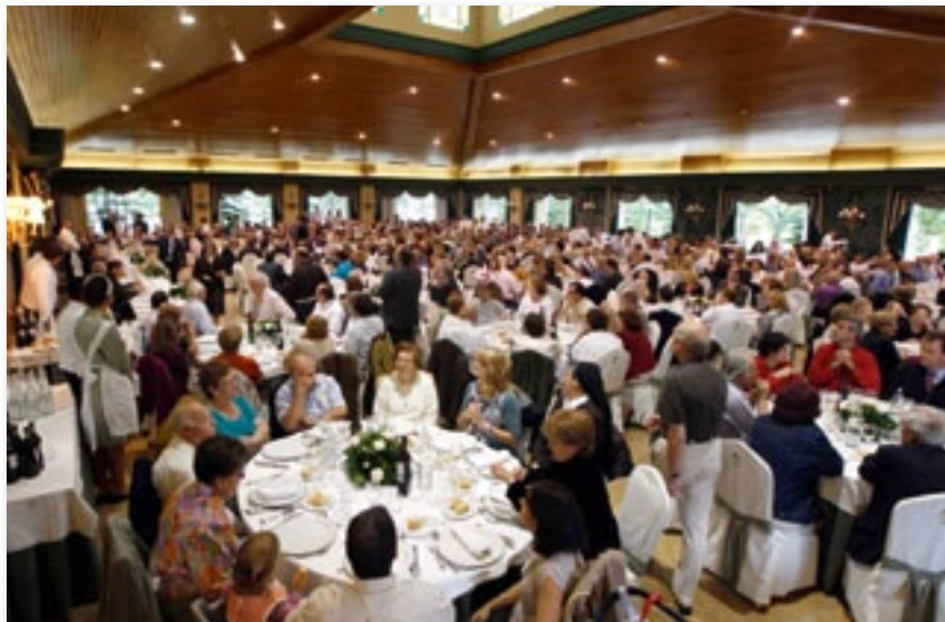
▲ Vista general.

ral al Venerable Padre Luis Amigó ante el monumento erigido en su honor en la plaza consistorial.