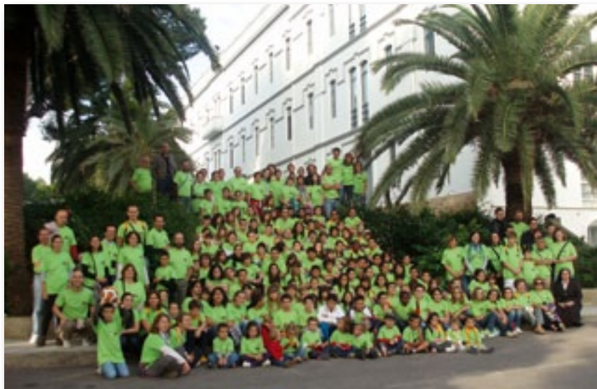
▲ El grupo de los jóvenes.