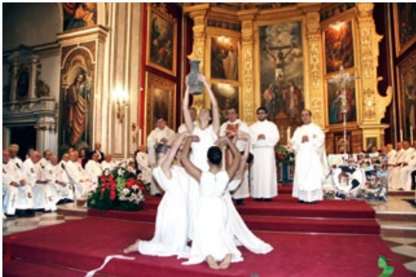
▲ Ofrenda del agua.

dos grupos de personas: el de los jóvenes y el de los mayores. El primero de ellos, de unos trescientos cincuenta asistentes -como muestra la información gráfica adjunta- ha dispuesto de tres días de celebraciones jubilares. Han acudido jóvenes procedentes de Albacete (Hellín), Castellón de la Plana (Segorbe y Nules), Madrid (Santa Rita y Fundación Caldeiro), Navarra (Burlada y Pamplona), Sevilla (Dos Hermanas), Teruel, Valencia (Torrente) Gelsenkirchen (Alemania) y, naturalmente, de otras diversas instituciones de la Comunidad Valenciana.