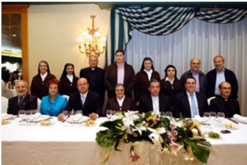
▲ Mesa de presidencia.

A continuación de la acción litúrgica se dio paso a la sonora masclatá disparada en los aledaños del templo y, seguidamente, a una ofrenda flo-