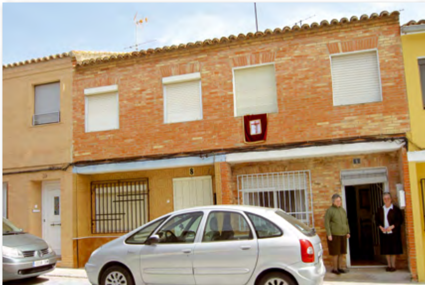
▲ Casita de las hermanas

En el presente la guardería infantil cuenta con cuatro aulas, de unos quince alumnos por aula, dado que la normativa actual no permite más. Los niños provienen de los vecinos pueblos de Foyos, Puebla de Farnals, Rafelbuñol y, de Massamagrell, por supuesto, si bien con una especial preferencia por los provenientes del Barrio de La Magdalena. En la actualidad son 66 los niños de la Guardería Infantil Padre Luis Amigó atendidos por tres religiosas y personal seglar.