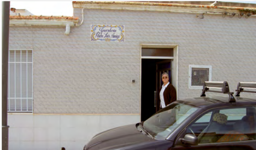
Hermana abriendo la guardería ▲

dicha Guardería Infantil Padre Luis Amigó de que nos ocupamos. Los padres capuchinos, apoyados asimismo por las hermanas terciarias capuchinas y el tesón de las autoridades del pueblo, en la actualidad están consiguiendo un barrio sencillo, limpio, muy bien trazado y muy bien comunicado, con amplias calles y rotondas, y adecentado con ocasión de estar levantándose junto al mismo una barriada moderna.