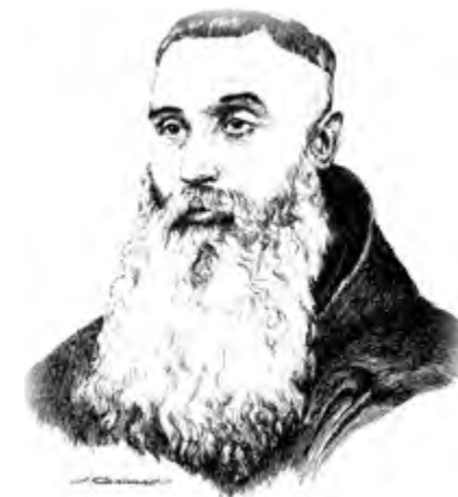
M.R.P. Luis de Massamagrell ▲

80. La última víctima que tuvimos del cólera fue un sacerdote novicio el cual, pocos días antes de morir, me decía: ¡Padre guardián, yo pido al Señor que si ha de morir del cólera algún religioso más de esta comunidad, que sea yo, que para nada he de servir en la Orden! Palabras que daban bien claramente a entender su profunda humildad