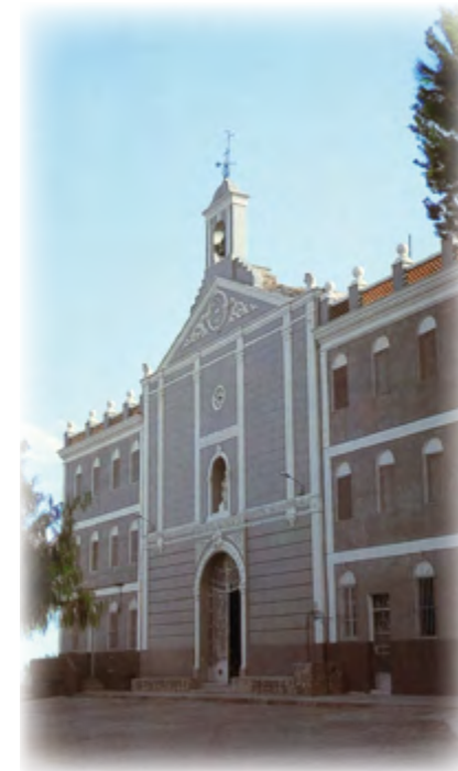
Santuario de Montiel-Benaguacil-Valencia ▲