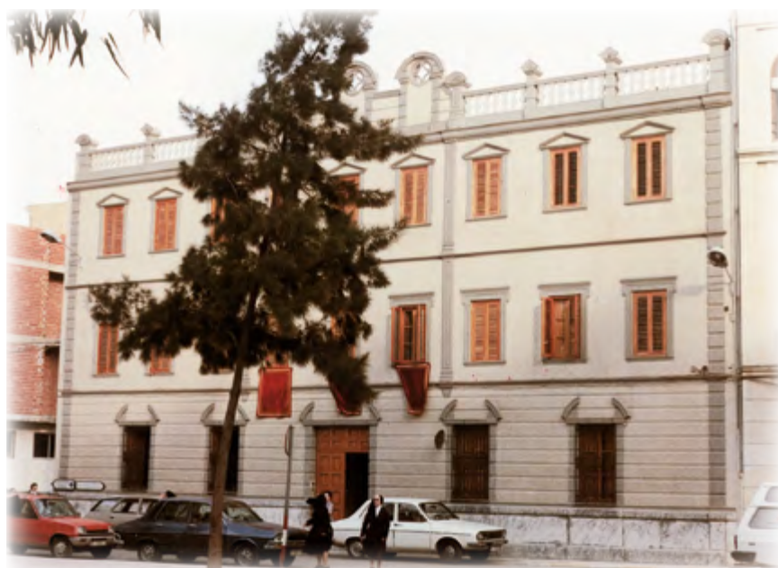
Convento HH. Terciarias Capuchinas. Massamagrell ▲