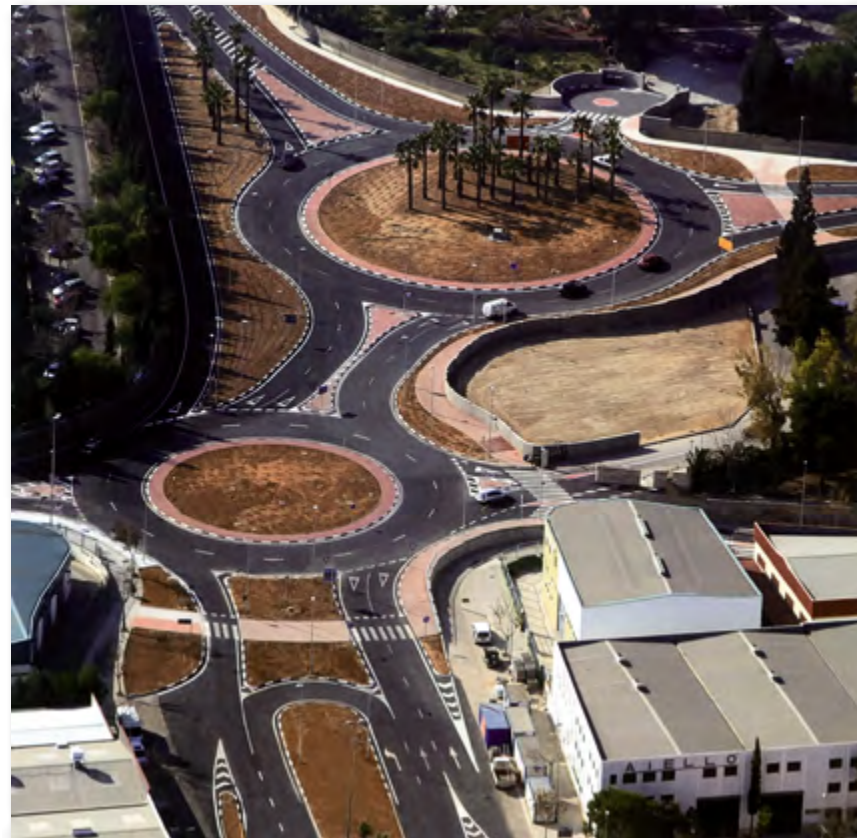
Glorieta de acceso al Seminario y a EPLA ▲

Para quien contempla con amor el bronce del Venerable Luis Amigó fácilmente podrá descubrir en sus rasgos y actitud al capuchino en el vigor de la madurez, peregrino infatigable, dotado de una gran mansedumbre, paz y serenidad; concordia, dulzura y benignidad. “Pues –como afirma la Regla que él da a sus hijos espirituales– para esto han sido llamados los hermanos y las hermanas: para curar a los heridos, vendar a los quebrantados y volver al recto camino a los extraviados”.