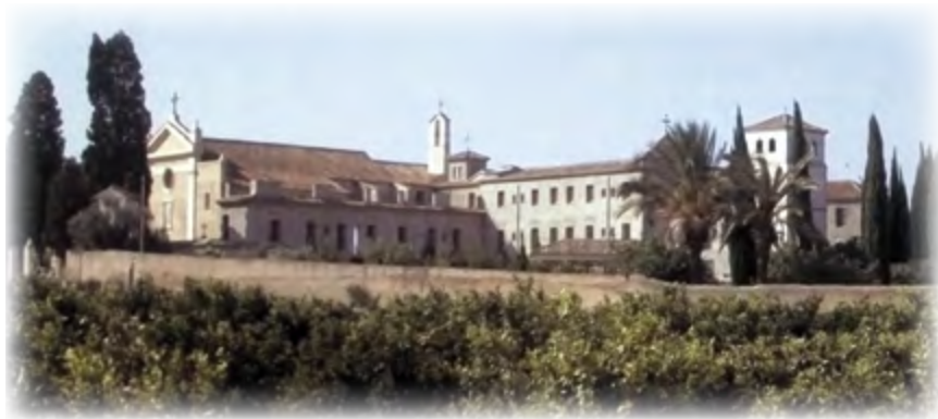
Convento de La Magdalena. Massamagrell ▲

«Ahora bajaré yo al refectorio con el P. Luis y repartiremos el pan que haya entre cada uno de los puestos de los religiosos»; lo que hicimos poniendo un pedacito de pan para cada uno. Y como, según la costumbre de la Orden, lo único que podemos pedir, si nos falta, es pan y agua, y en aquella comunidad, por ser la mayor parte jóvenes, no obstante ponerles buena ración de pan muchos de ellos siempre pedían más, era por lo mismo de esperar que a poco de empezar a comer empezarían a levantarse para pedir pan. Por ello, me decía el Padre Guardián: «Hoy va a ser una risa lo que sucederá en