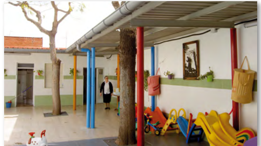
Patio de recreo de los niños ▲