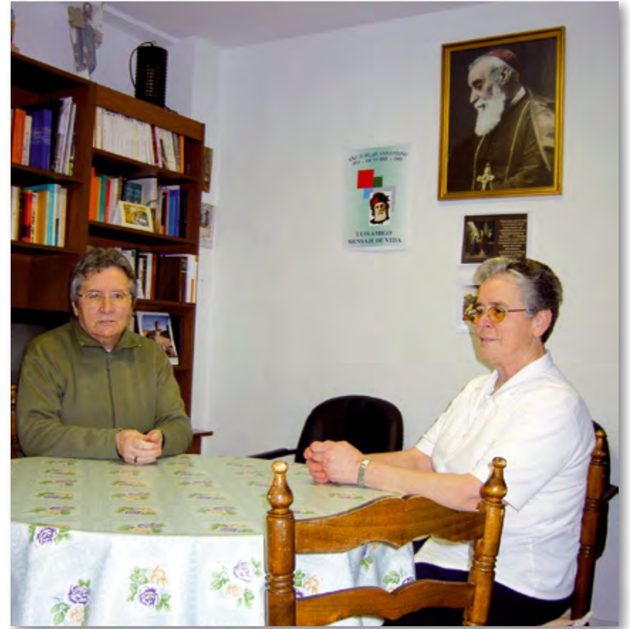
Sala de la comunidad ▲