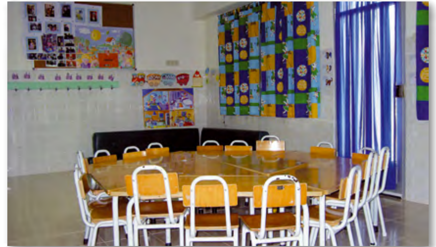
Una de las aulas de la guardería ▲

En este barrio de La Magdalena los padres capuchinos, a más del convento, regentan la iglesia de Nuestra Señora del Rosario, cerca de la que se levanta la