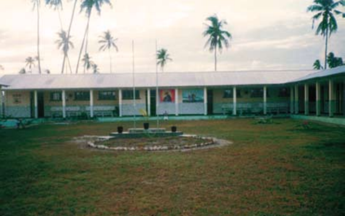
KIGAMBONI – Tanzania: Patio de la Escuela Luis Amigó ▲ Aspirantes, Novicias y Religiosas ▼