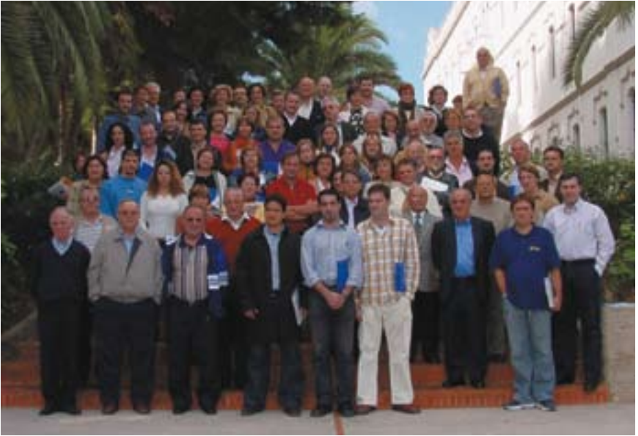
Educadores Amigonianos: En el Seminario San José, de Godella Ante el monumento a Luis Amigó, Segorbe