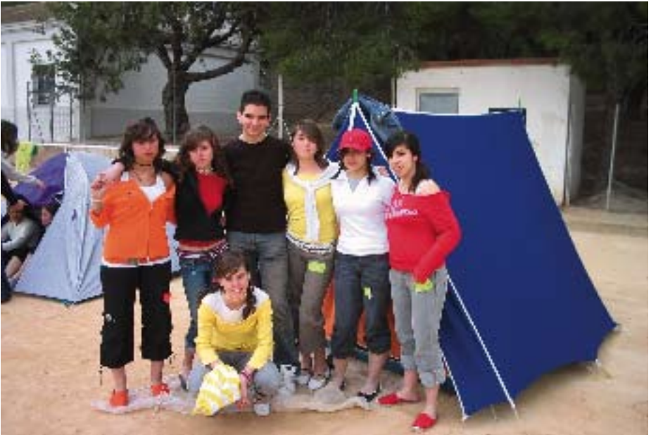
Grupo de acampados ▼