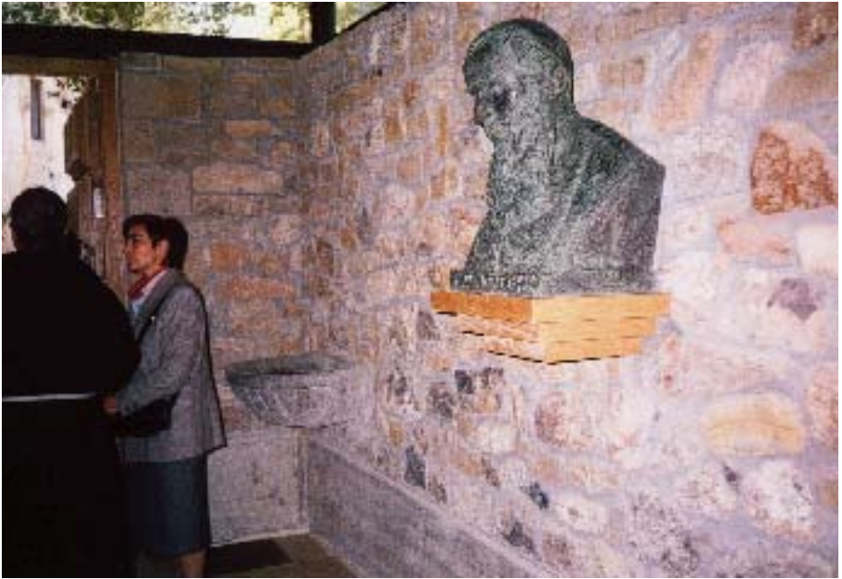
▲ Busto de Luis Amigó, obra de Pablo Serrano Familia Capuchino Amigoniana ▼