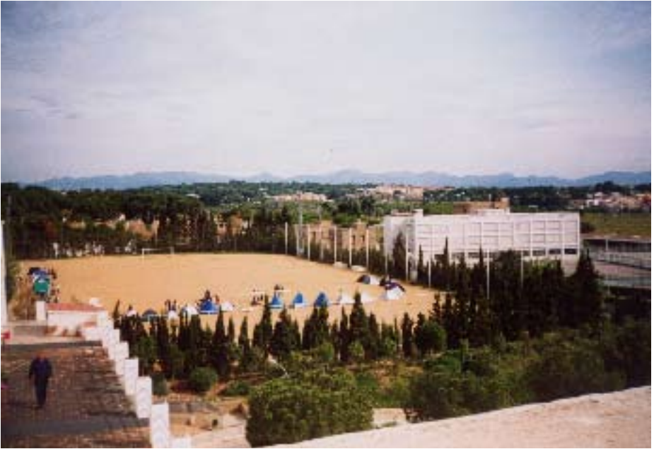
▲ Plantación de tiendas