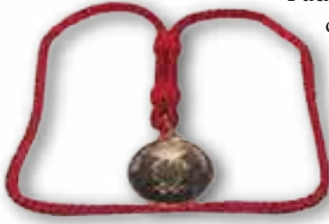
► Medalla de oro otorgada.