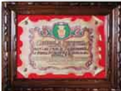
► Pergamino acreditativo.