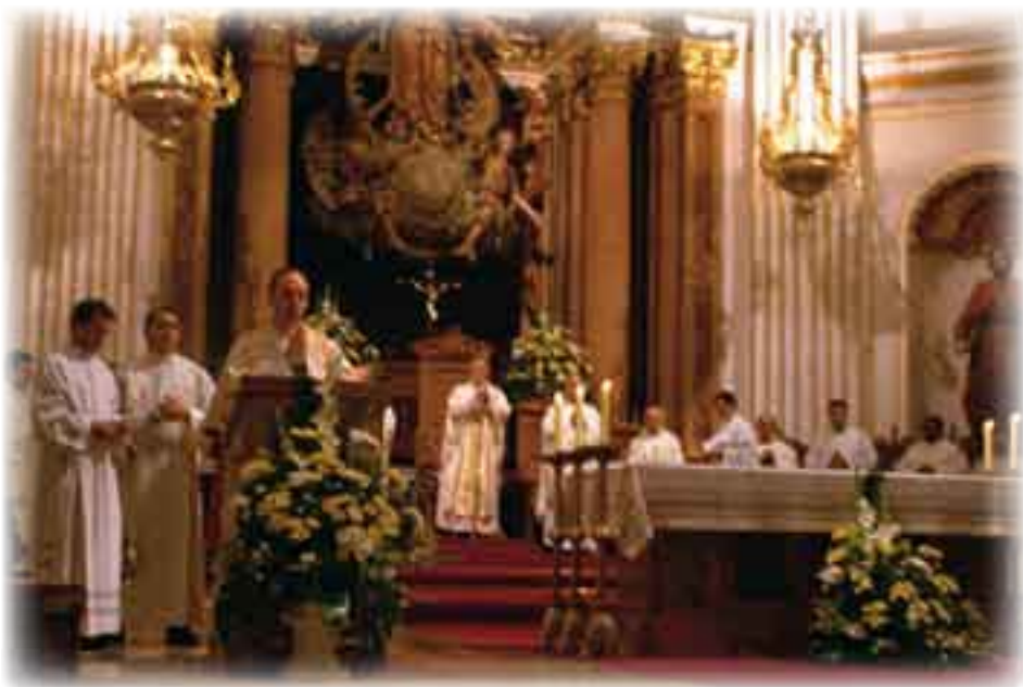
► Misa pontifical en la catedral de Segorbe (Castellón).