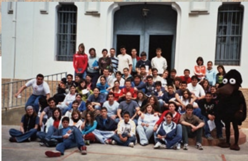
▲ Grupo de campistas y... Zagaloli

la Última Cena. Así mismo reflexionaron sobre la obra de Luis Amigó, la que es imposible entender sin la Eucaristía de cada día. Por esto nuestro compromiso con los necesitados se acabará si no lo hacemos desde una vivencia auténtica de este acontecimiento central en la vida del cristiano.