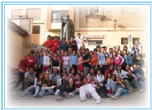
▲ Segorbe (Castellón): Foto del grupo

La XXª Acampada Juvenil Luis Amigó se celebró, como ya viene siendo tradicional, en el Seminario San José de Godella, Valencia, los días del 22 al 24 de abril del presente año 2005.