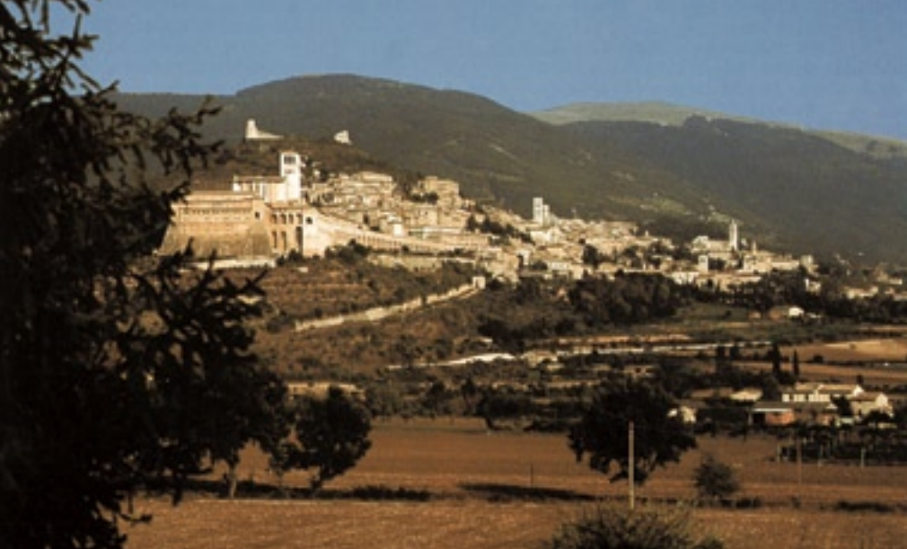
▲ Asís: vista de la ciudad

los muertos, por donde escapa a ampararse bajo el manto del Obispo Guido, y más allá el templo de Minerva en la plaza del Ayuntamiento, centro y corazón de la noble ciudad de Asís.