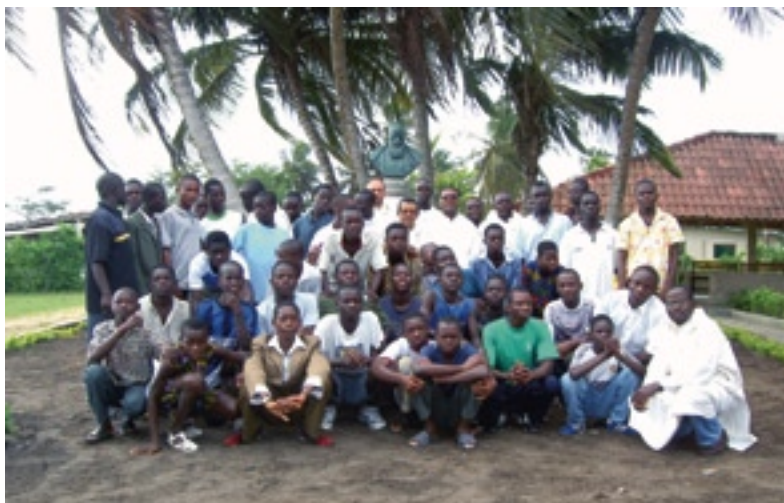
▼ Estudiantes del Centro Amigó Doumé