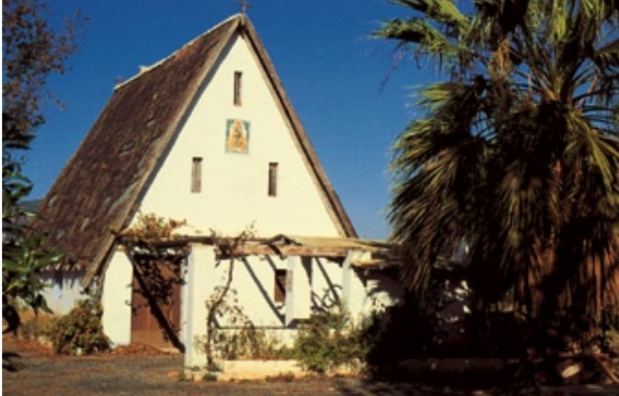
▲ Barraca valenciana

Antiguamente, según Blasco Ibáñez, el despertar de la huerta era delicioso, especialmente amable los domingos y días festivos. Rodaba el canto del gallo de barraca en barraca. Los campanarios de los pueblos volvían con ruidoso badajeo el toque de la primera misa que sonaba a lo lejos y el espacio se empapaba de luz. Se apreciaba algún que otro huertano que, tardío, apresuraba sus pasos para alcanzar, desde su barraca o alquería, la vecina parroquia.