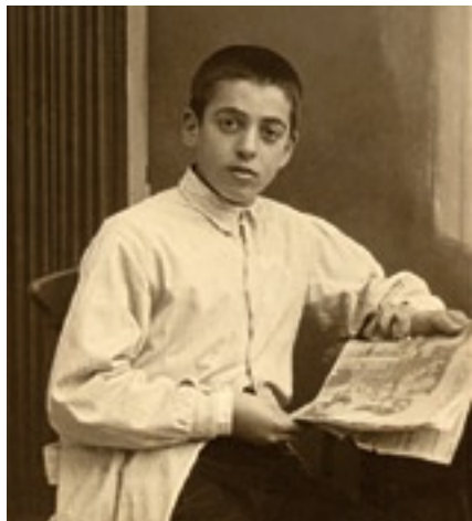
▲ El siervo de Dios a los 14 años