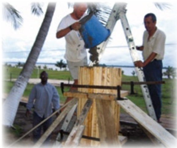
▲ Llegada del busto a Abidján

Frecuentemente abrimos la Hoja Informativa del Venerable Luis Amigó con alguna institución dedicada a su nombre y puesta bajo su protección. Hoy lo vamos a hacer con el monumento elevado en su honor, en una institución que se honra con su nombre Amigó Doumé, es decir, Amigó de la Laguna, y situada en la ribera de la laguna Ebrié, de Abidján, en Costa de Marfil.