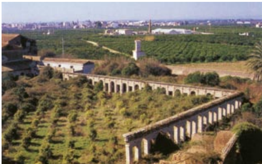
El Puig: Claustro mayor de la cartuja. ▲