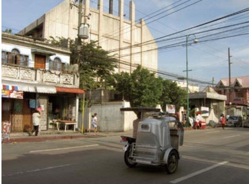
Manila: Parroquia Mater Dolorosa ▲

después de su llegada a las Islas, concretamente en fecha 17 de octubre de 1986, se erige ya la primera fraternidad amigoniana en el Extremo Oriente bajo la denominación de Comunidad Luis Amigó .