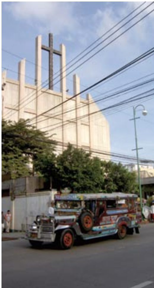
Manila: Transporte público. ▲