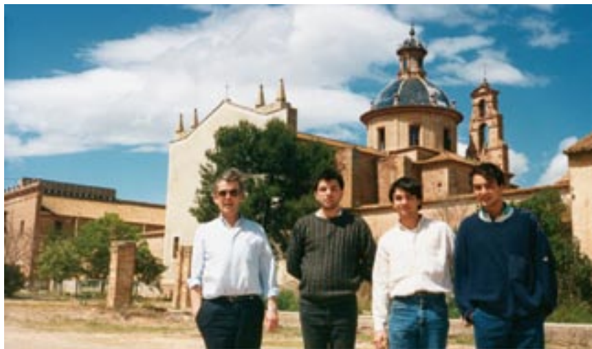
Religiosos amigonianos visitando la cartuja. ▲

Sigue el cortejo por un caminito de tierra y, antes de alcanzar la carretera de Valencia-Sagunto, tuerce a la izquierda para embocar la amplia alameda de cipreses –hoy lo es de olivos antañones– que conduce directamente a la entrada principal de la cartuja. Sobre la puerta de ingreso una hornacina, con la imagen de san Bruno en talla, delata la presencia de sus antiguos inquilinos.