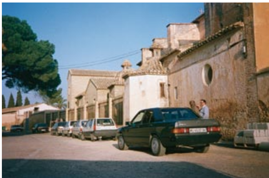
Masamagrell: Convento capuchino de la Magdalena. ▲

Por otra parte los primeros franciscanos se reúnen en sus tiendas, en la Campa de Asís, para fortalecer su espíritu en torno a la Señora y ver de cumplir mejor su Regla y Vida . El Real Monasterio del Puig, dedicado a nuestra Señora de los Ángeles, es una nueva porciúncula amigoniana, en torno a la cual acampan las milicias de las órdenes terceras, para tratar de cumplir mejor su Regla y Vida y, asimismo, para implorar de la Señora la libertad del Señor Papa.