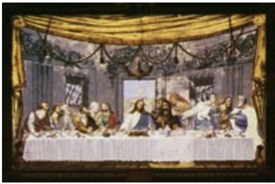
▲ Santa Cena del refectorio cartujano

tina en los claros días de la primavera. Me llega la brisa marina, con su olor a sal y a mar. Y también el grato olor a azahar que todavía se desprende de las últimas flores del naranjo. Un poco a oriente El Puig de Santa María, a continuación el poblado de La Creu, llamado hoy Puebla de Farnals, y sin solución de continuidad Masamagrell y Museos. Un poco más allá, Meliana, Almácer a y Alboraya. Sigo con la vista la suave curva ondulada de la bahía, hasta otear al fondo la Malvarrosa y el Grao de Valencia.