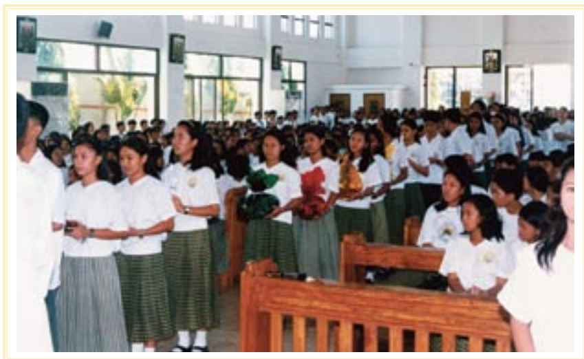
Misa fin de curso en la parroquia ▼

En la residencia de Makati, Metro Manila, la actual fraternidad amigoniana trata de llevar a cabo, y siempre con las normales dificultades del lugar, la obra religiosa y social que su buen padre fundador les diera. Cuenta con un magnífico complejo parroquial, obra en su mayor parte del padre Javier Cabezas, situado en una de las barriadas más pobres de Manila. En dicho complejo los hermanos disponen de un templo parroquial, amplio y capaz, y de una feligresía que, especialmente los domingos y días festivos, llena el templo con una liturgia viva y participada. En líneas generales, y como asistencia media, rebasa el número de cinco mil los feligreses que cumplen con el precepto dominical.