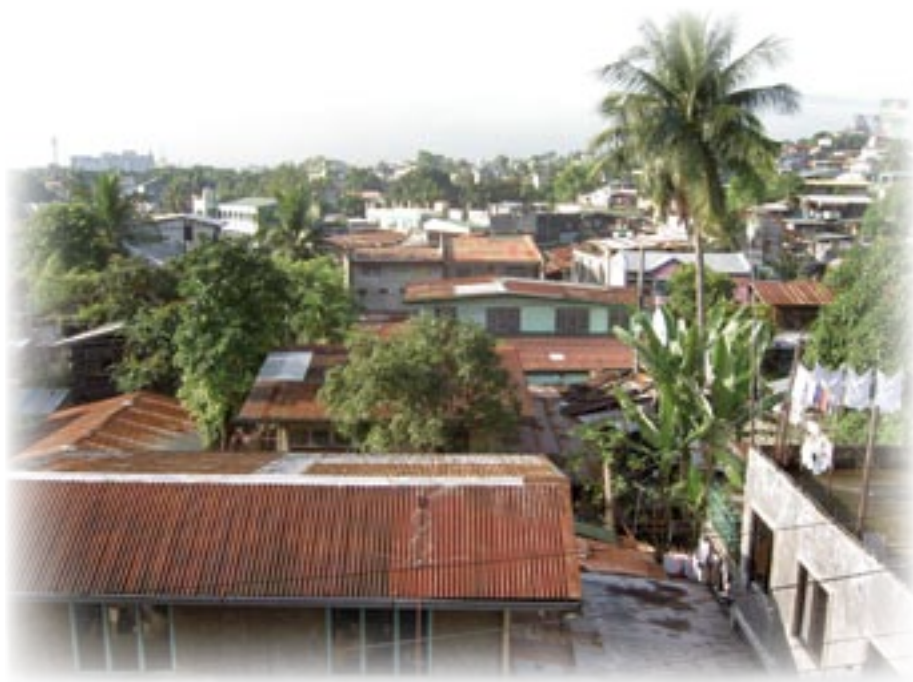
▲ Manila: Barriada parroquial.

Con ocasión de los veinte años de la erección canónica de la Comunidad Luis Amigó de Makati, Metro Manila, Filipinas, con gozo otorgamos hoy a la fraternidad los honores de portada la Hoja Informativa del Venerable Luis Amigó.