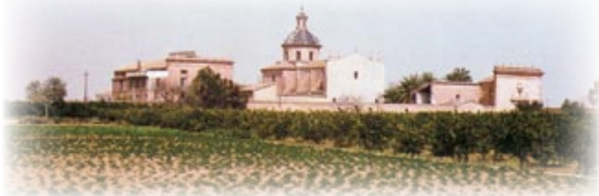
▲ El Puig: Panorámica de la cartuja de Ara Christi.

Perdón, últimamente han usado asimismo el monasterio unos jesuitas italianos, procedentes de Laval, Francia, quienes por algún tiempo le dedican a casa seminario de la Compañía. Pero lo abandonan pronto por la insalubridad del lugar y la escasa comodidad que las edificaciones ofrecen.