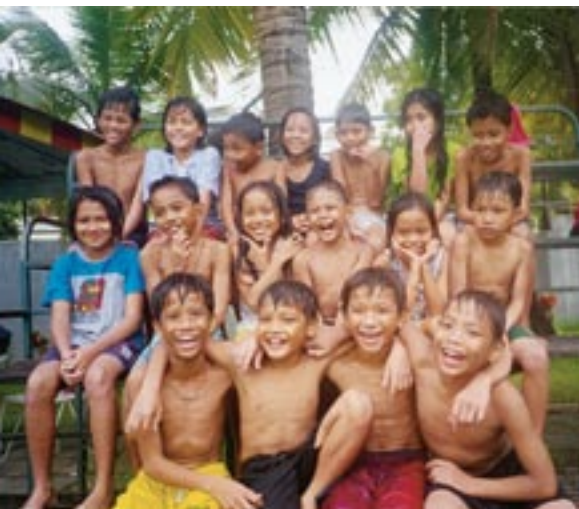
▲ Grupo de internos.

En la residencia de Makati, Metro Manila, la actual fraternidad amigoniana trata de llevar a cabo, y siempre con las normales dificultades del lugar, la obra religiosa y social que su buen padre fundador les diera. Cuenta con un magnífico complejo parroquial, obra en su mayor parte del padre Javier Cabezas, situado en una de las barriadas más pobres de Manila. En dicho complejo los hermanos disponen de un templo parroquial, amplio y capaz, y de una feligresía que, especialmente los domingos y días festivos, llena el templo con una liturgia viva y participada. En líneas generales, y como asistencia media, rebasa el número de cinco mil los feligreses que cumplen con el precepto dominical.