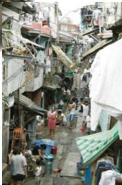
▼ Calle del barrio Malate, Manila.