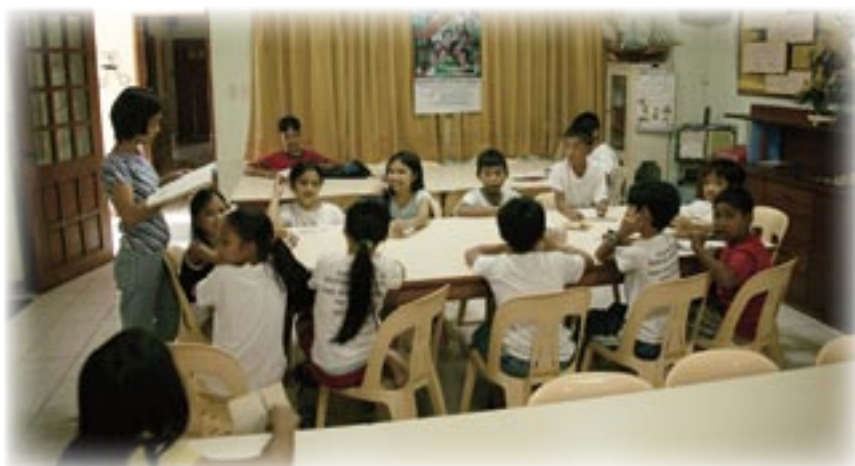
▼ Clase de la Institución.