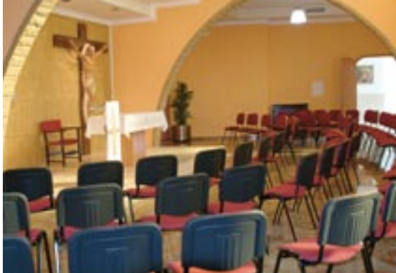
▲ Aula de reuniones Luis Amigó y Capilla privada del Santuario.

enmohecida, y el lugar para el carbón y la leña de algarrobo, completan la desprovista cocina.