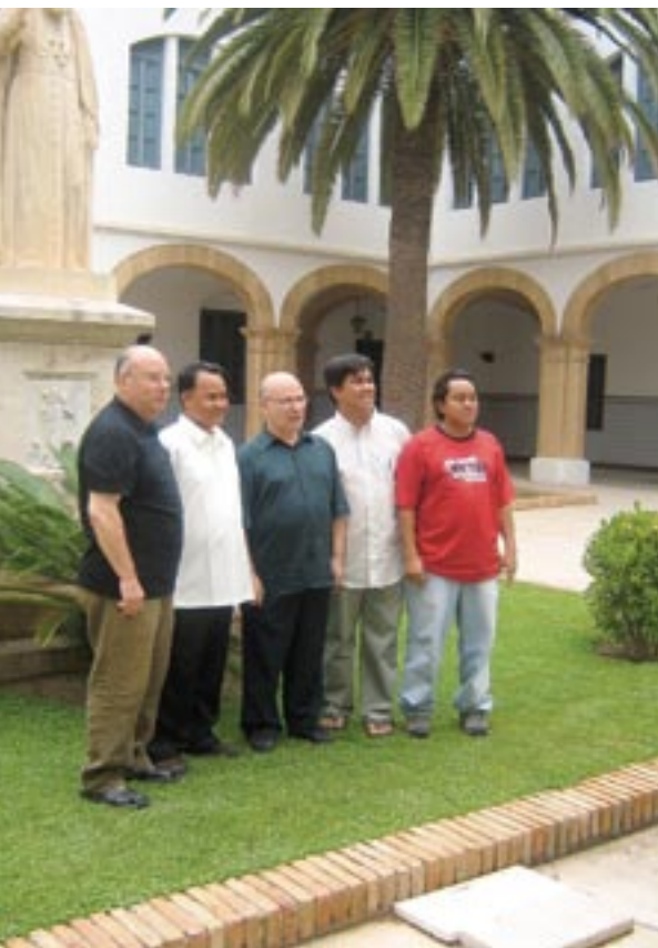
▲ Grupo de Filipinas.

Alemania, Brasil, Colombia, Costa Rica, Estados Unidos, Filipinas, Italia, Nicaragua, Panamá, Polonia y naturalmente, de España.