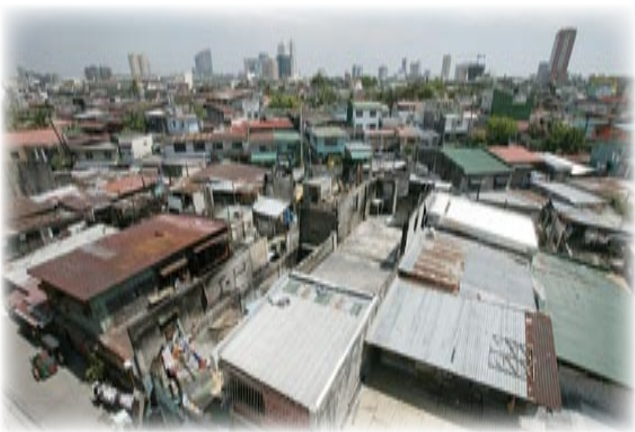
▲ Barrio Malate, Manila.