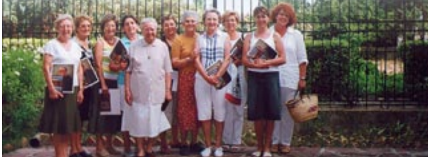
▲ Movimiento Laical

E l Movimiento Laical Amigoniano, como su mismo nombre indica, es una asociación de laicos de ambos sexos, que, animados por el espíritu franciscano, integran la familia amigoniana y, cada cual a su modo, participan de su forma de vida y de su misión apostólica. Es decir, los laicos amigonianos son cristianos llamados por el Espíritu, desde su vocación secular, a seguir a Cristo viviendo el evangelio con el espíritu y el talante del Venerable Padre Luis Amigó.