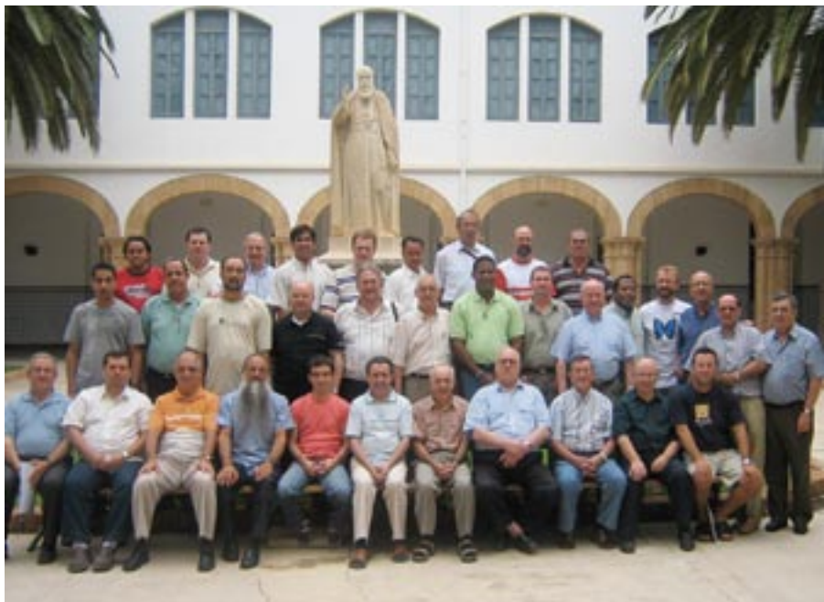
▲ Grupo de participantes.