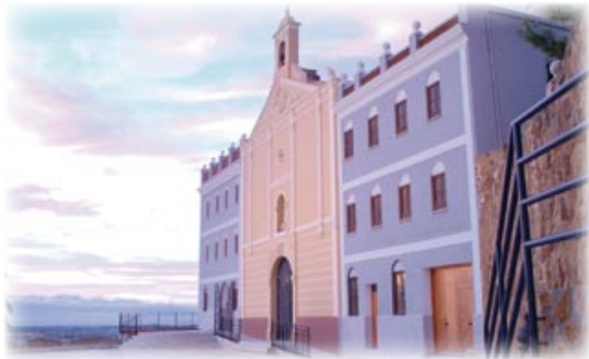
▲ Santuario de Montiel. Fachada principal.

Luis Amigó, normalmente, escoge sus fechas más significativas con verdadero mimo. Las elige con la precisión del más consumado de los orfebres. Las establece con la determinación con que da el golpe un tallista de diamantes. Para sus peregrinaciones por la vega valenciana, en la primavera o bien entrado el otoño. Sabe que son las dos estaciones más deliciosas en la huerta levantina. Para sus fundaciones, a comienzos de la primavera, cuando brotan las primeras siembras en los campos. ¿Acaso una fundación no es un brote en esperanza? ¿No es la apertura seminal al primer sol y a la vida?