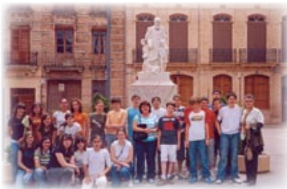
▲ En memoria del Fundador.