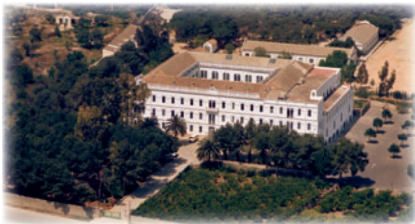
Vista aérea del Seminario de San José ▲

En el ambiente ya se percibe olor otoñal. Como de fruta madura. Amanece. Desde la terraza de mi convento percibo un día claro, sereno, azul. Desde lo alto contemplo el más bello amanecer de la huerta. Se divisa perfectamente, por entre las torres de apartamentos blancos, la línea azulada del mar. Antes, al amanecer, se podía observar incluso el retorno de los pescadores. Y también el arrastre a la ribera de las humildes barquichuelas que volvían al amanecer cargadas de pescado fresco. Era la pesca del bou. Y, luego, en las playas de la Mavarrosa o del Cabañal, se veía a familias enteras que se afanaban en clasificar el pescado recogido por el patrón durante la noche. Las familias disfrutaban. Si era día de pesca abundante, para ellas era día de gloria.