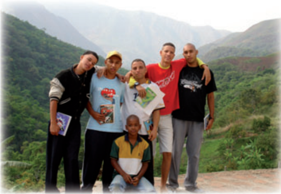
◀ Alumnos del Centro