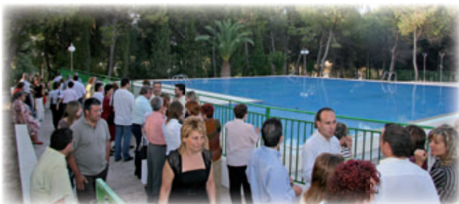
▲ Piscina del Seminario San José

Abandonamos la iglesia conventual por la puerta del atrio y ascendemos al primer piso. Entramos en las habitaciones que fueron la última mansión del Venerable Luis Amigó. Recientemente se han convertido en capilla para la reflexión. Son dos estancias pobres, humildes, silenciosas. Son testigos mudos de los últimos momentos de la vida del Fundador de la familia amigoniana. ¿Permiten ustedes que evoquemos los hechos?