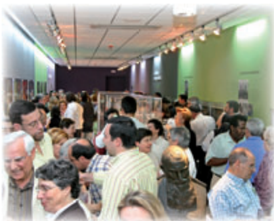
Inauguración del Museo Luis Amigó ▲