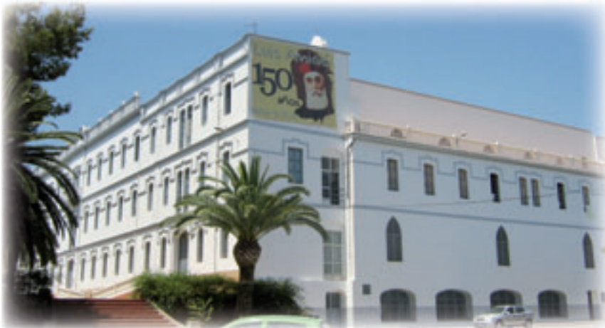
Fachada de la Casa-Seminario ▼

Luis Amigó, inicialmente, desea recibir sepultura en la cripta de esta casa noviciado de San José de Godella, Valencia. Aquí, donde él ha contemplado la colocación de la piedra angular del convento, la primera piedra. Posteriormente cambia de parecer. En su testamento ordena recibir sepultura en la casa de sus religiosas, en su pueblo natal de Masamagrell. Es su última voluntad. Y, como la última voluntad de un padre, se cumple. Sin embargo sus hijos espirituales siempre han considerado la casa noviciado de San José de Godella caput et mater de la Congregación. Es decir, su buque insignia, su casa solariega, la casa madre del instituto.