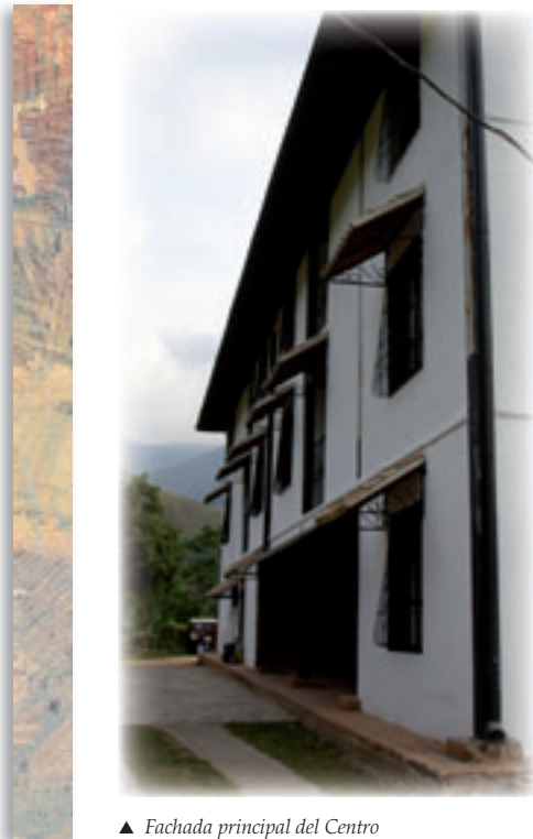
▲ Fachada principal del Centro

Tanto en el centro cerrado de Pie de Monte, como en el centro abierto de La Victoria se aplica la pedagogía amigoniana en la rehabilitación de jóvenes con problemas la conducta y deficiencias familiares y sociales, alejados del camino de la verdad y del bien, para su reinserción en la familia y en la sociedad venezolana.