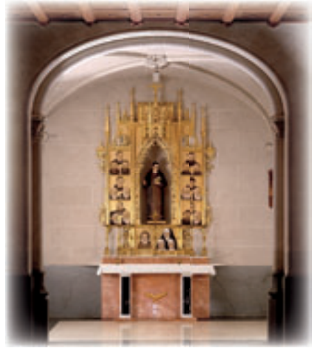
Altar de los Mártires Amigonianos ▲