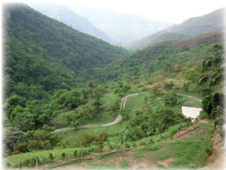
▲ Vista desde el centro Fray Luis Amigó

La Victoria (Estado de Aragua) Venezuela