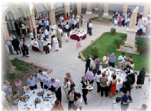
▲ Fiesta en el Claustro

Integran la casa madre postulantes, novicios, jóvenes profesos y religiosos mayores. Y en ella se forman, teórica y prácticamente, los jóvenes. Se forman para “la grande obra de la reforma de la juventud que el Señor ha encomendado a nuestra Congregación”, como escribe el Padre Fundador Luis Amigó. Godella sacro convento, caput et mater de la familia amigoniana.