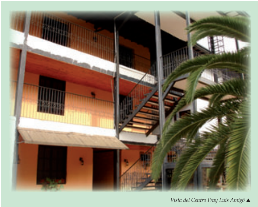
Vista del Centro Fray Luis Amigó ▲

el valioso apoyo de un nutrido grupo de Laicos Amigonianos, el aporte económico de diversas empresas y la supervisión de la Fundación Universitaria Luis Amigó de Colombia , la institución ha ido desarrollándose y tomando forma.