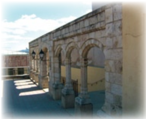
▲ Claustro de la Cartuja, en la Glorieta de Segorbe.

Pero el día de fiesta grande es el Día de la Natividad de Nuestra Señora. Ese día también sube el señor obispo, con su gayata y su pañuelo, como un peregrino