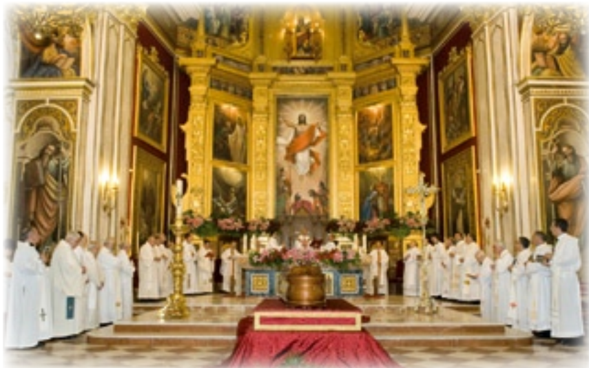
▲ Celebración eucaristía.

Con muy buen criterio los organizadores han sabido unir en un mismo acto la figura del Venerable Luis Amigó y la de don Juan Celda, por cuanto ambos son hijos ilustres de Massamagrell, fueron bautizados en la misma pila bautismal y