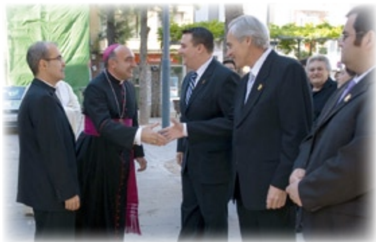
▲ Recepción del Sr. Obispo por las autoridades.