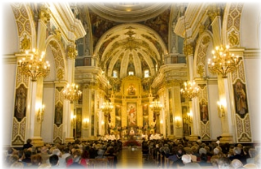
▲ Celebración eucaristía.