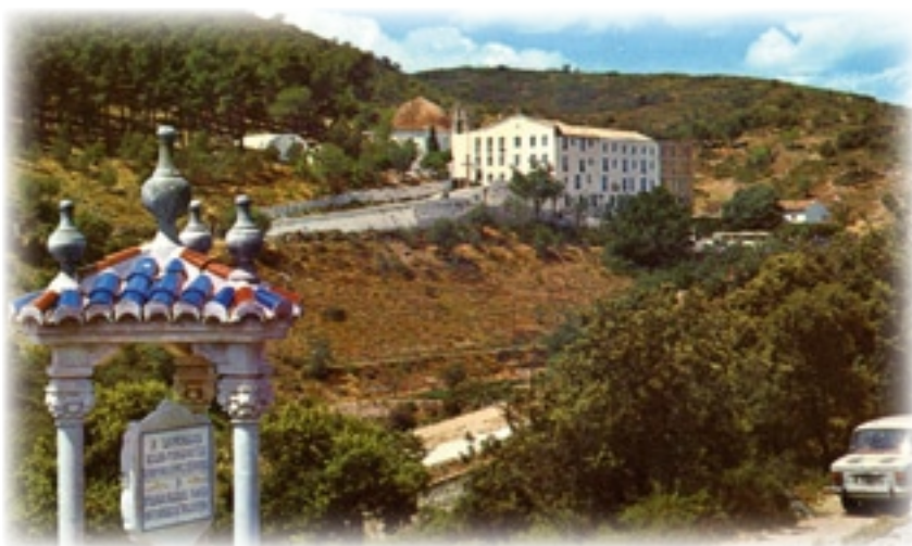
▼ Santuario de la Cueva Santa.