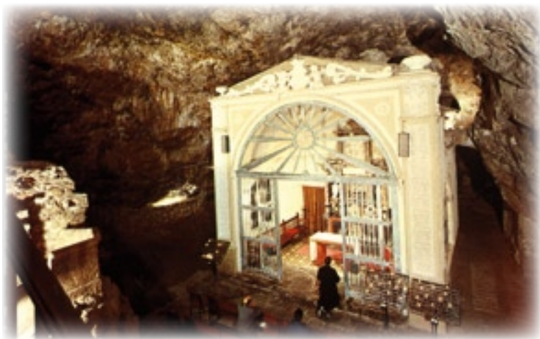
▲ La Cueva Santa. Interior.

más. Es la patrona de la diócesis. Tiene misa mayor en la gruta. Y habla con la gente.