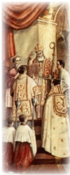
▲ Consagración de la iglesia. (Pintura de D. Juan Celda)