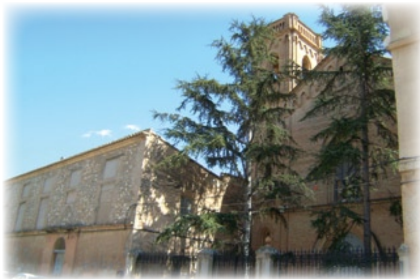
▲ Antigo convento franciscano de San Blas.