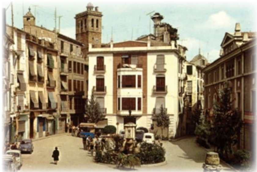
▲ Plaza del Agua Limpia