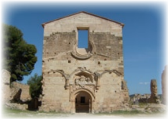
▲ Cartuja de Vall de Crist actualmente.

Ha disfrutado de un delicioso día de san Francisco, rubricado con el paseo vespéral que, como de costumbre, suele dar cada jueves.